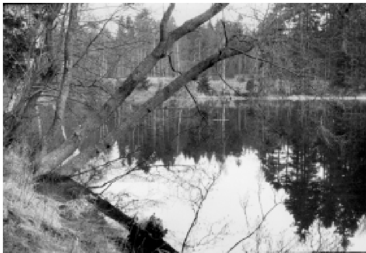
Kanál suchý - Šmelcovna: rybník U adjunkta

- kanál od Markova rybníka po vtok do Belé: zde bylo koryto potoka upravováno, místy zahlubováno nebo rozšiřováno pro dosažení příznivějších parametrů plavebního kanálu. Zajímavá je skutečnost, jak stavitelé dokázali dokonale využít místně dostupného materiálu. V horním úseku byl velký nedostatek kamene, koryto bylo tedy z velké části zpevněno a vyloženo dřevem. V této dolní části trasy je ve skalnatých svazích kolem potoka množství kamenů a balvanitých výchozů. Tento materiál byl tedy použit pro zpevnění koryta: boky byly zpevněny kamen-