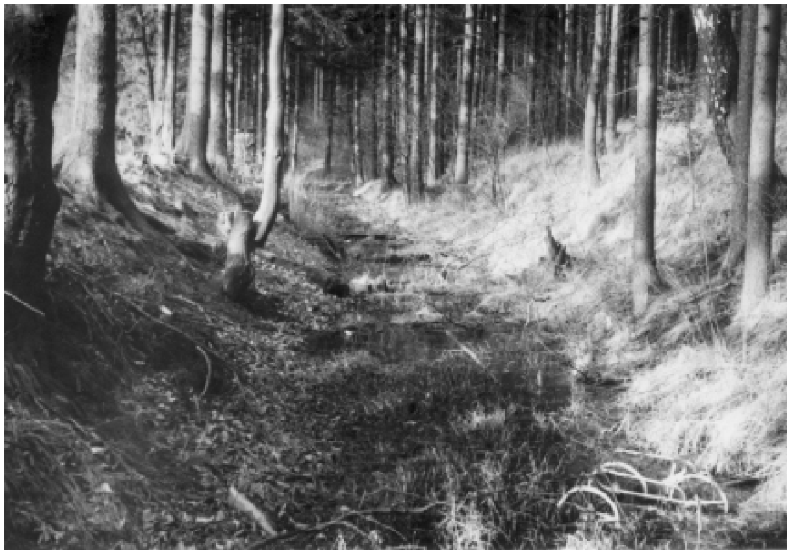
Kanál Suchý - Šmelcovna: profil koryta v horní části trasy

Při realizaci stavby dřevoplavebního kanálu ze Suchého na Šmelcovnu dokázali stavitelé využít nejen různých stavebních materiálů podle charakteru okolí kanálu (v horní části především dřevo, ve spodní části pak především kámen), ale také různých typů vodních cest (kanál vyložený dřevem, kanál vyložený kamenem, dřevěný vodní skluz, umělé koryto). Za zmínku