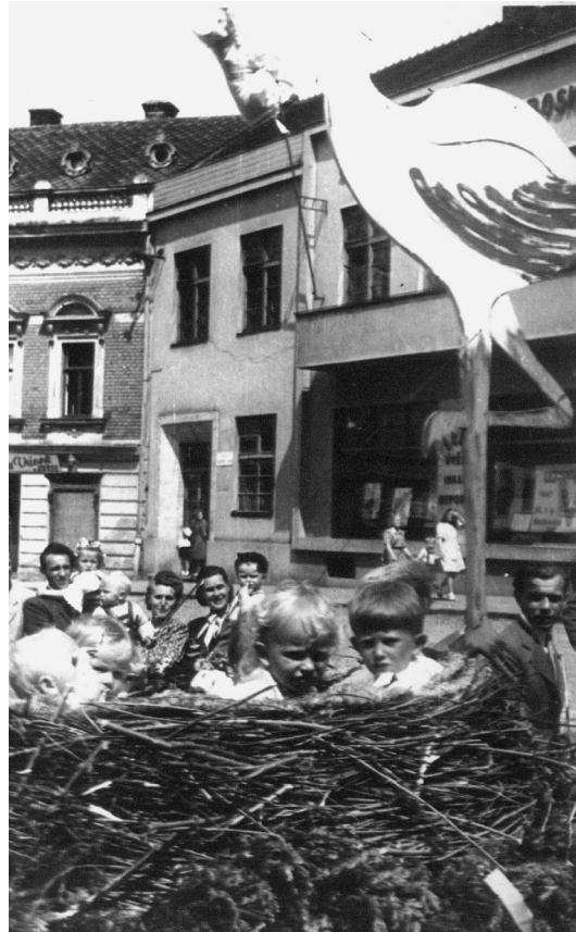
Malé děti hlídali v hnízdě čáp.