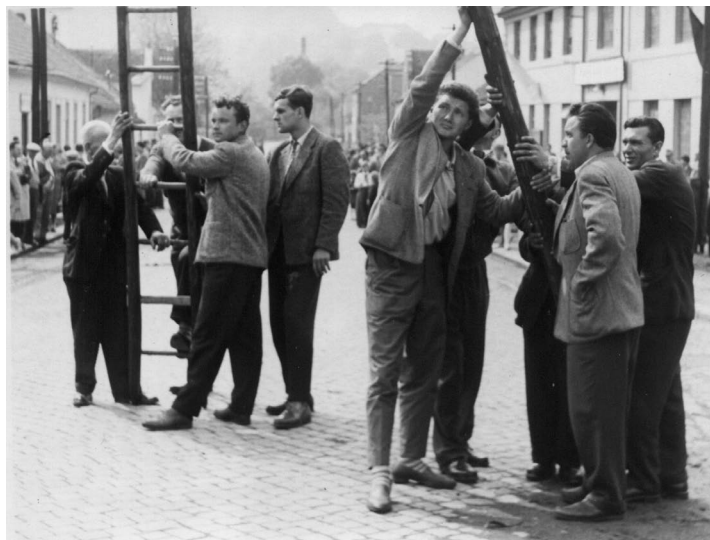
Stavění máje na Mazurii v roce 1947.