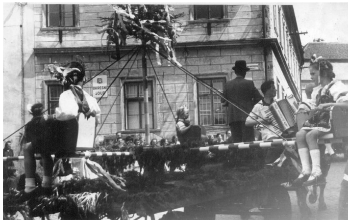
Vůz s kolotočem před starou radnicí.

I ti, které život zanesl od Mazurie daleko, jistě rádi vzpomínají, jak naši tatínkové a jejich kamarádi stavěli 1. května vysokánský máj. Byla to velká podívaná. Do dechové hudby kapelníka Antonína Trapla se ozývaly hlasité pokyny „chlapů“ stavějících máj pomocí žebříků, což bylo velké umění a vyžadovalo jistě dost praxe a zručnosti. A když už ve vší parádě máj stál a shora nám mávaly na pozdrav veselé barevné fábročky, všichni zatleskali. A aby se májíčku pěkně stálo, nakonec