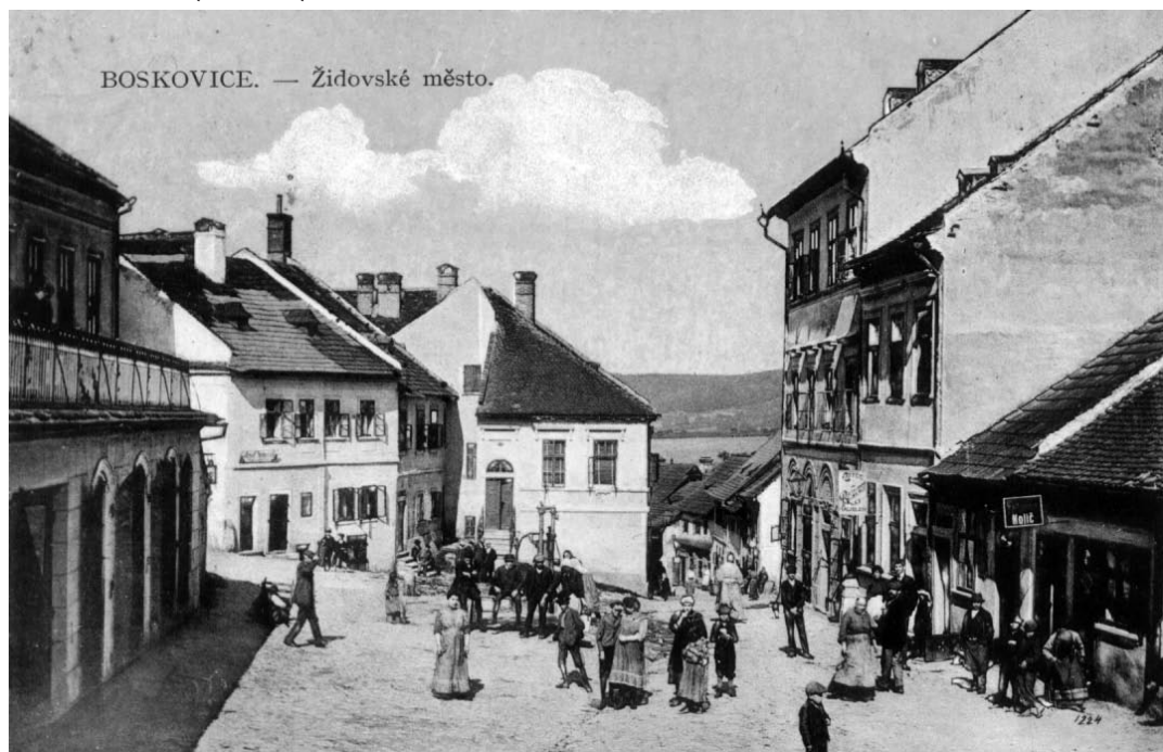
Historická pohlednice - Boskovice, U Vážné studny.