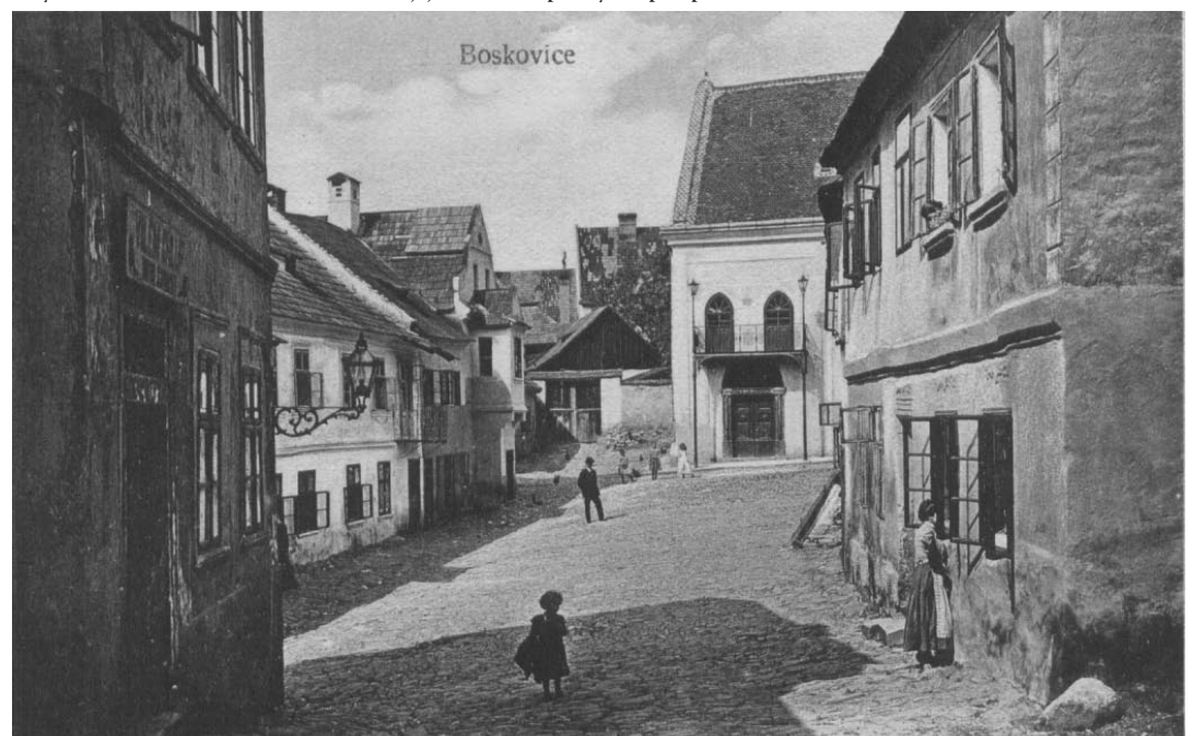
Historická pohlednice boskovického židovského města.