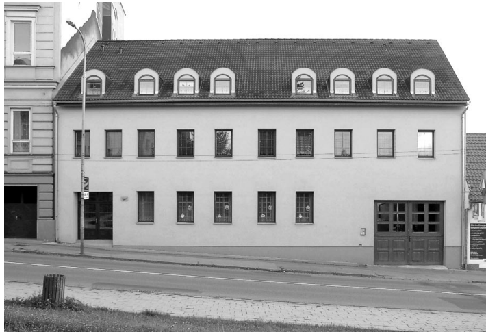
Moderní internát s kapacitou 40 lůžek.

V souvislosti s vývojem v naší společnosti dochází k velkým změnám v oblasti středního školství. Také Střední pedagogická škola v Boskovicích prošla za 60 let různými problematickými okamžiky, přesto má pevné a ojedinelé postavení mezi středními školami okresu, a neod-