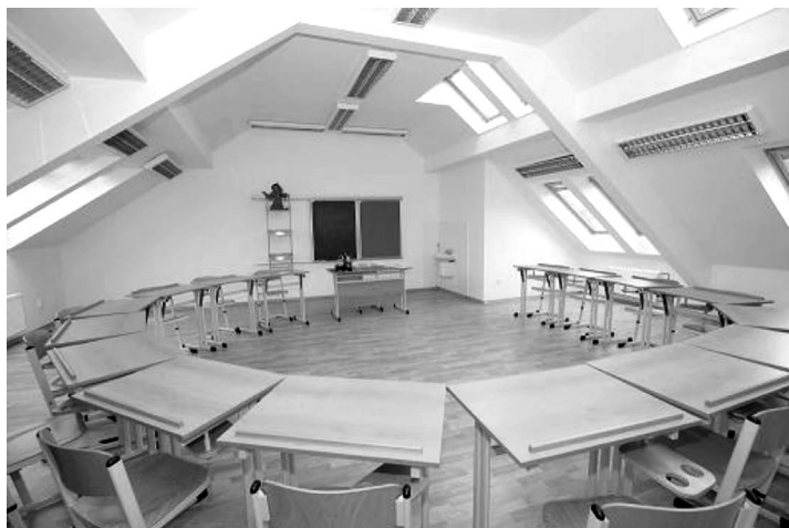
Nový ateliér výtvarné výchovy.

mi studenti často navštěvoval výstavy, učil je chápat výtvarné umění. Ve škole pak pořádal „galerie na chodbě“, kde umožňoval prezentaci výtvarných prací studentů.