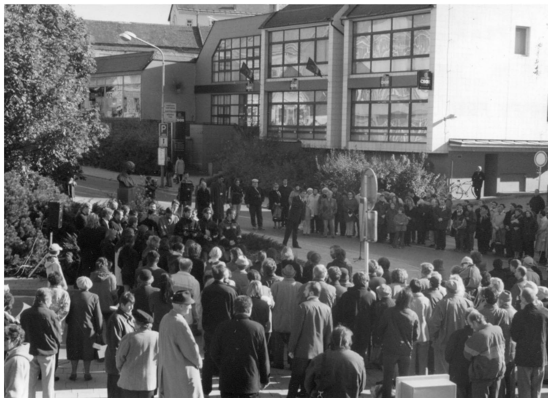
Slavnostní odhalení busty Otakara Kubína v roce 2003.