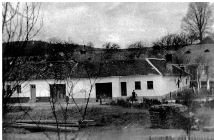
Zděné domy na návsi v Malé Roudce. V popředí upravo chaloupka čp. 17.

Pokud bývaly široké komíny, udivalo se maso tam zavěšené za provázky na