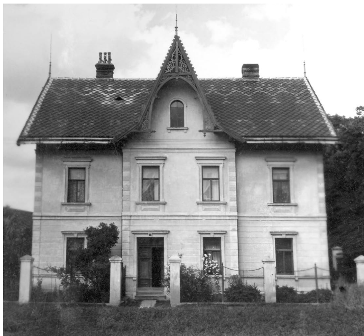
Šebetov, vila č.p. 111 kolem r. 1950.

Podrobnější architektonické zhodnocení budovy nechám na odbornících, dovoluji si pouze stručně konstatovat, že F. Berka řešil vzhled vily podle právě aktuálního, řekněme „módního trendu“, jímž se na přelomu 19. a 20. st. stalo tzv. michání slohů (též elektismus). Zatímco čelní fasáda vykazovala do výše prvního