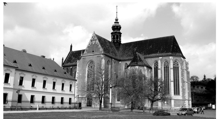
Starobrněnský klášter založený Eliškou Rejčkou a Jindřichem z Lipé. Arkleb zde byl častým hostem a svědkem darování majetků klášteru různými šlechtici.