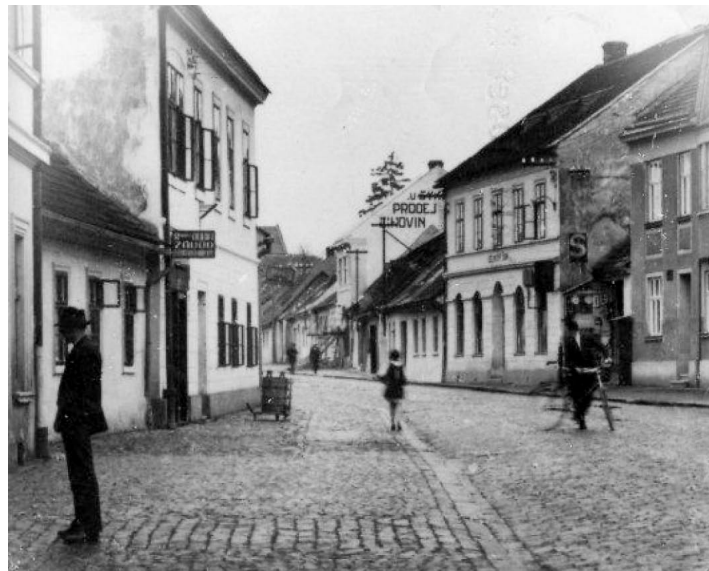
Ulice Jevícká (dnes ul. 17. listopadu).