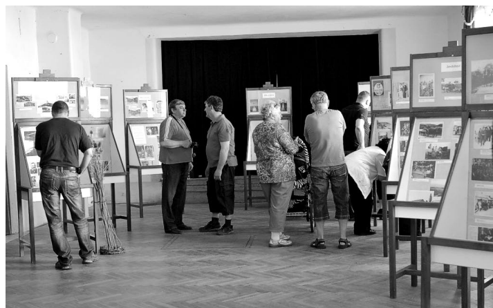
Výstava fotografií v chrudichromském kulturním domě.