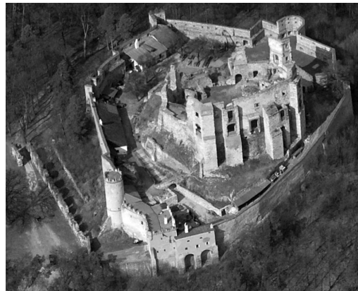
Boskovický hrad, vystavěný pány z Boskovic na přelomu 13. a 14. století je poprvé uváděn v listině z r. 1313